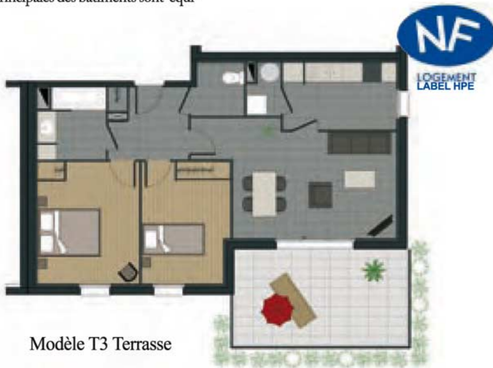
Modèle T3 Terrasse