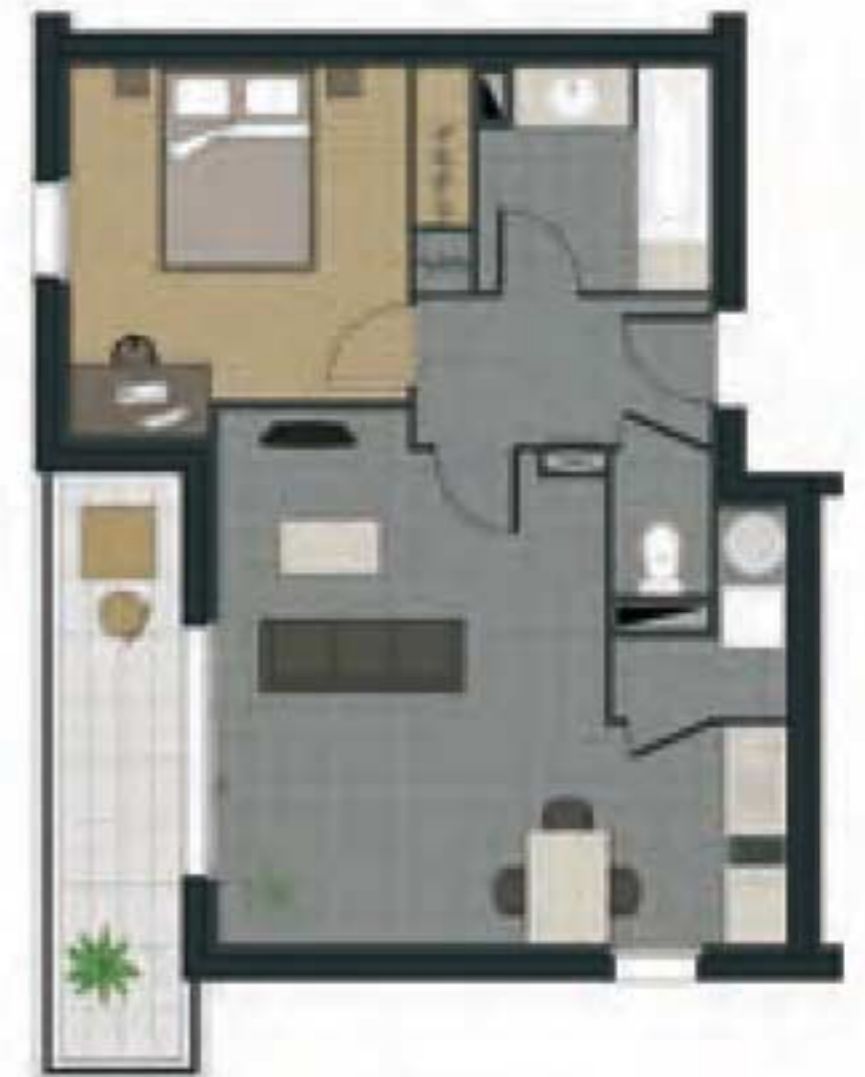
Modèle T2 balcon